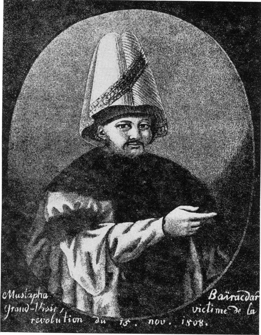
Res. 3 : Alemdar Mustafa Paşa'nın ölümü üzerine yayımlanan bir gravürü (aslı Viyana'da, Ottokar von Schlechta-Wasehrd'in kitabından).