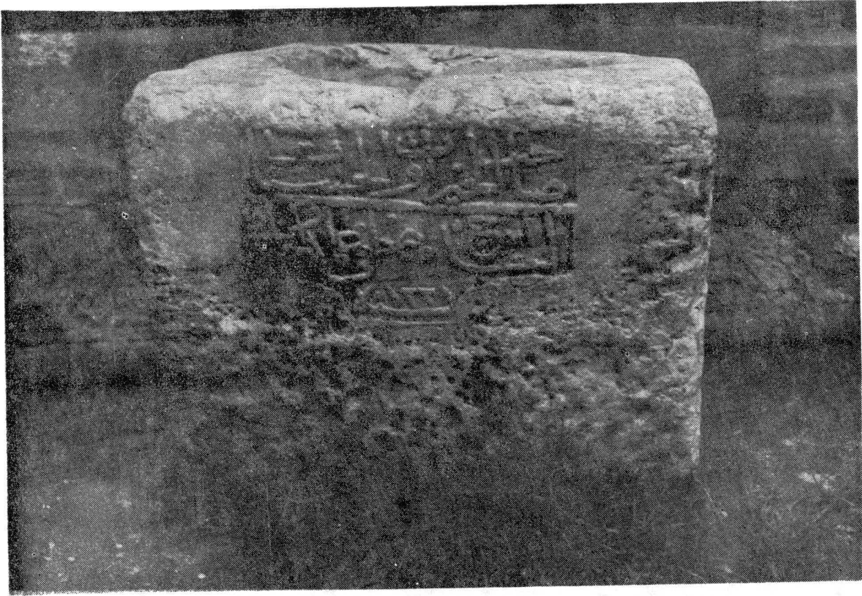
Res. 4 : Goleşti konağının kapısı önündeki türkçe kitabeli yalak.