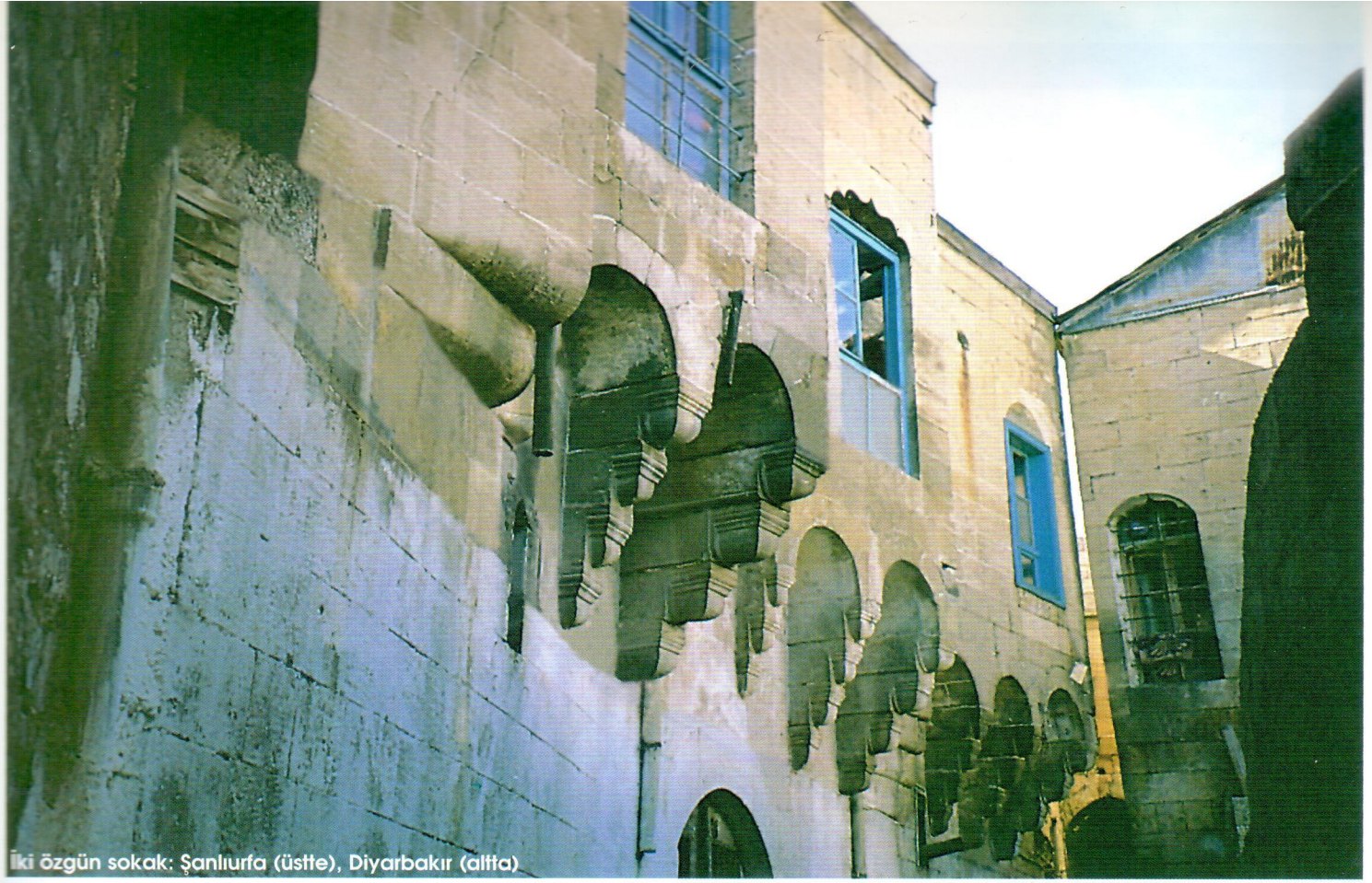
İki özgün sokak: Şanlıurfa (üstte), Diyarbakır (altta)