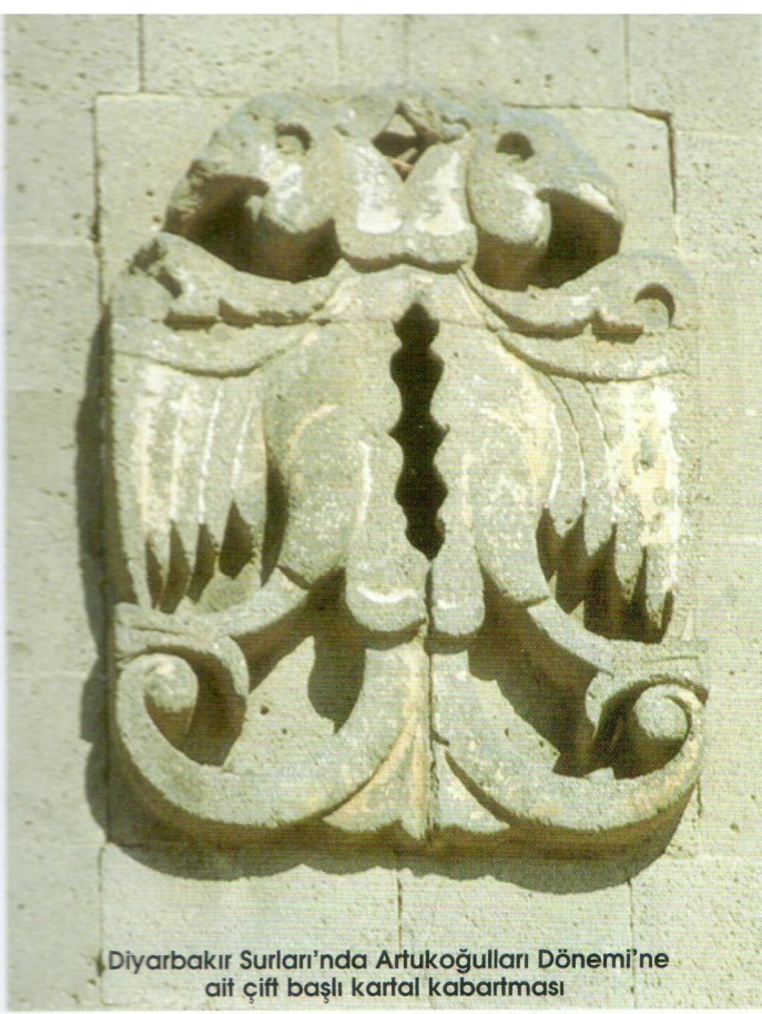
Diyarbakir Surları'nda Artukoğulları Dönemi'ne ait çift başlı kartal kabartması

maktadır. Bunu bir dizi kalıcı etkinlik izleyecektir. ÇEKÜL Vakfı da “Her Bölgede Bir Kenti Kurtaralım” kampanyasında Güneydoğu Anadolu'da Midyat'ı seçmiş, ardından başta Dicle Üniversitesi yetkilileri olmak üzere diğer illerdeki uzman ve sanatçılar bu kente katkıyı hızlandırmış, böylece ilk güçlükler aşılmıştır.