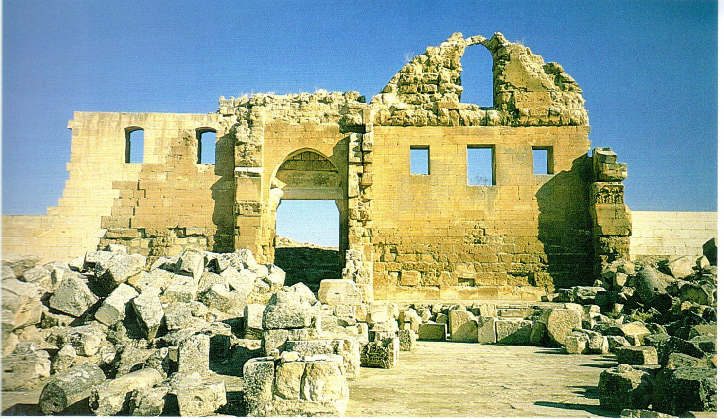
Harran Ulu Camisi (üstte) Şanlıurfa Ulu Caminin minaresi (altta)