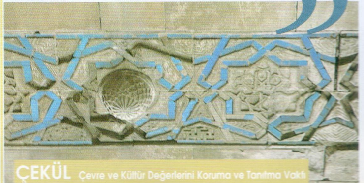
ÇEKÜL Çevre ve Kültür Değerlerini Koruma ve Tanıtma Vakfı