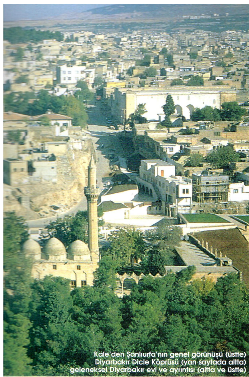
Kale'den Şanlıurfa'nın genel görünüşü (üstte) Diyarbakır Dicle Köprüsü (yan sayfada altta) geleneksel Diyarbakır evi ve ayrıntısı (altta ve üstte)