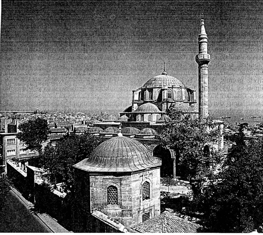
Cerrah Mehmed Paşa Külliyesi'nden genel görünüm. Aras Neftçi

dikdörtgen alanların üzeri ikişer küçük kubbe ile örtülmüştür. Yapı dış köşelerden ve yanlardan da payelerin hizasından duvar payandaları ile takviye edilmiştir. Payeler üstte yarım kubbeler arasından yukarı doğru ağırlık kuleleri şeklinde yükselmiş olup ana kubbenin eteği hizasında payanda kemerleri ile sonlanarak kubbeyi destekler.