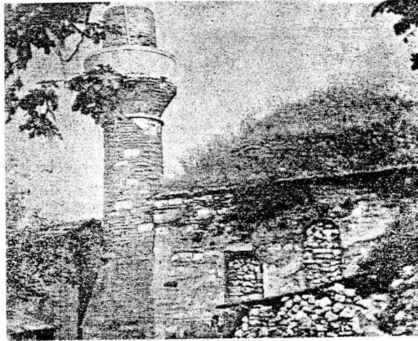
Resim 1. Mimar Ağa Mescidi, Eski bir fotoğraf (Konyalı'dan)

5) Ayrıca H. 8 Şevval 1169 (=M. 6 Temmuz 1756) gecesi Cibali'den çıkan yangında bir kol Vefa Meydanı'na ve Şehzade Camii'ne kadar ilerlemiştir. 20 Mescit bu tarihte meydana gelen yangında da tahrip olmuş olmalıdır.