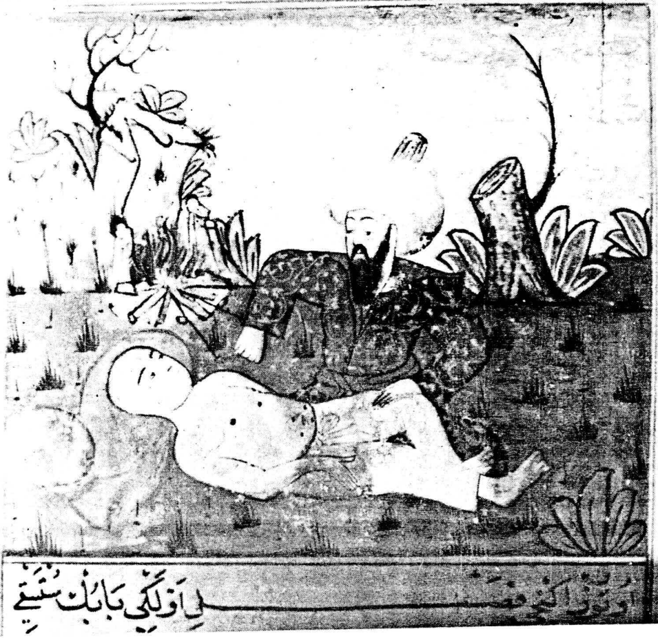
Resim 4. Varak 9 a El ve ayaklardaki hastalığın dağılamayla tedavisi.