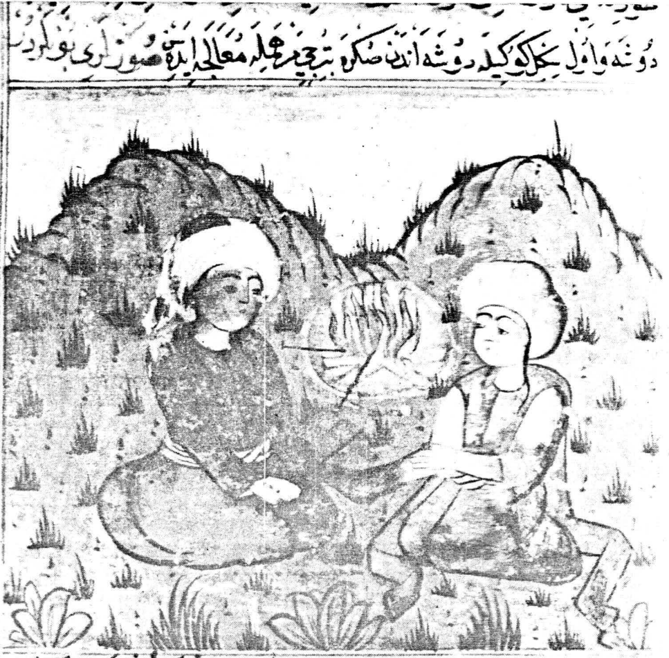
Resim 12. Varak 27 b Adale ağrılarınin dağlamayla tedavis