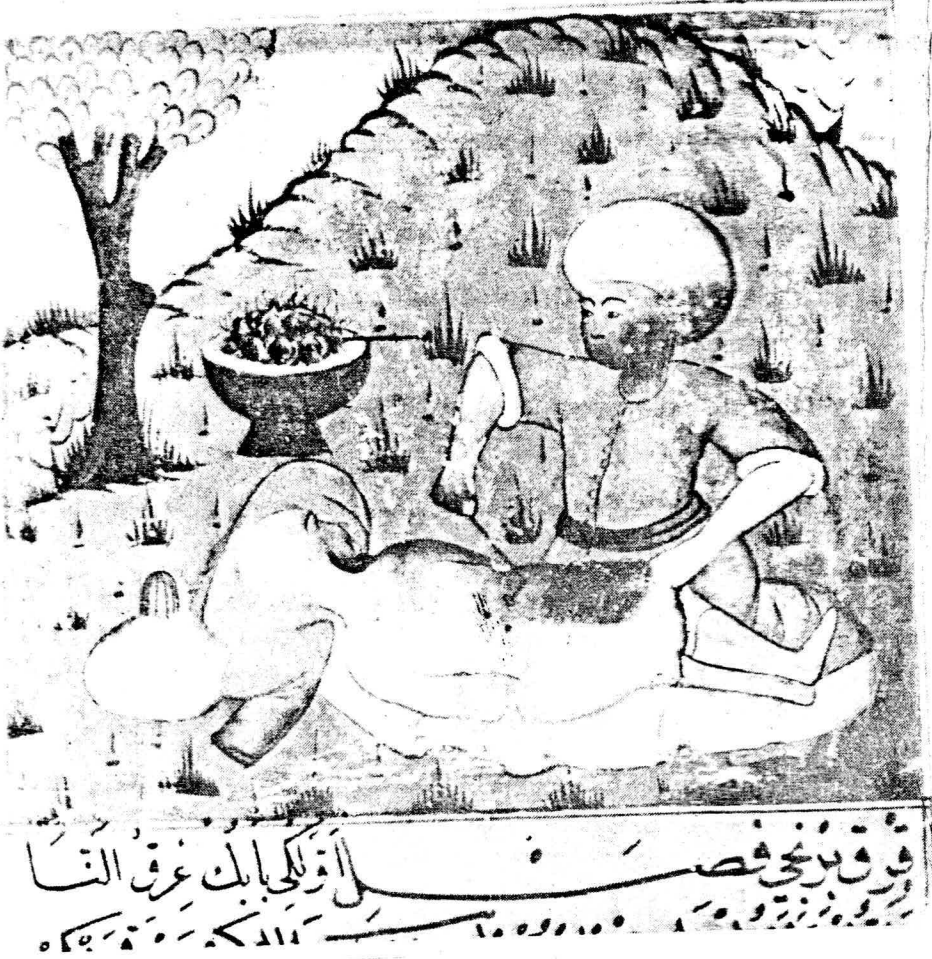
Resim 8. Varak 14 a Müzmin soğuk algınlığının tedavisi