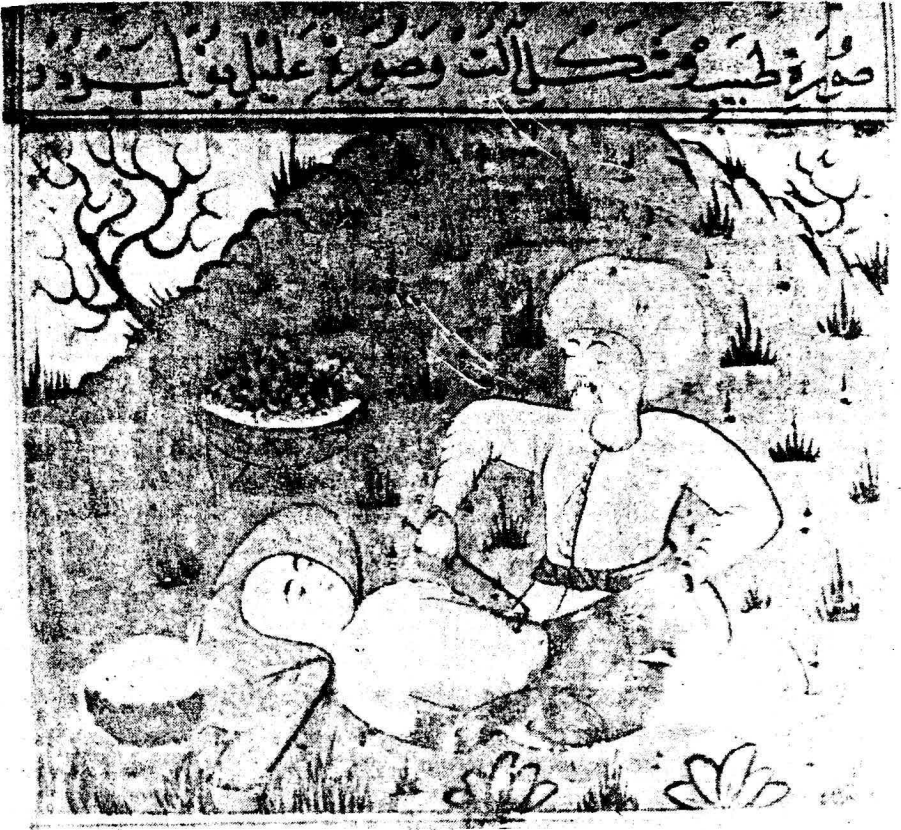
Resim 6. Varak 12 Bb Erkeklerde dađlamayla mesane hastalığının tedavisi.