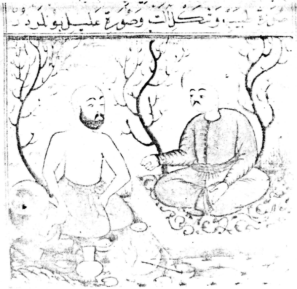
Resim 14. Varak 26 b Darnara sokulan bir şişle kanın tedavisi