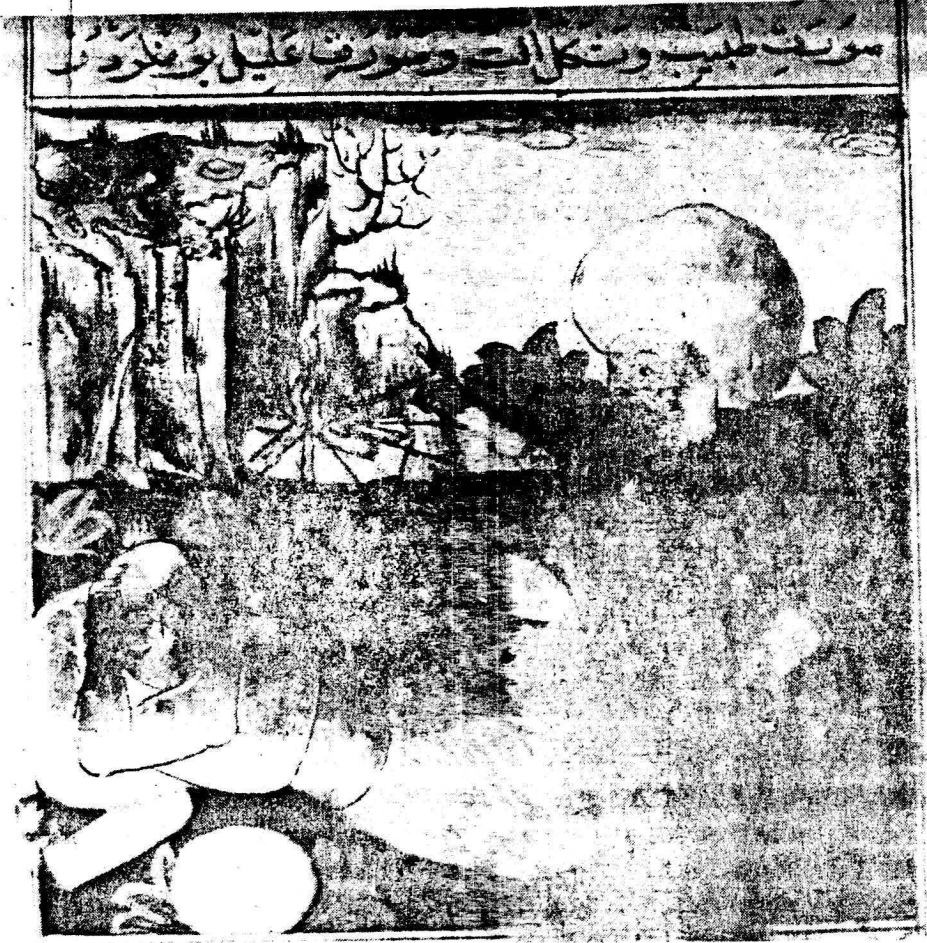
Resim 3. V. arak 8 a Ağrı ve sancıların cağıama ile tedavisi