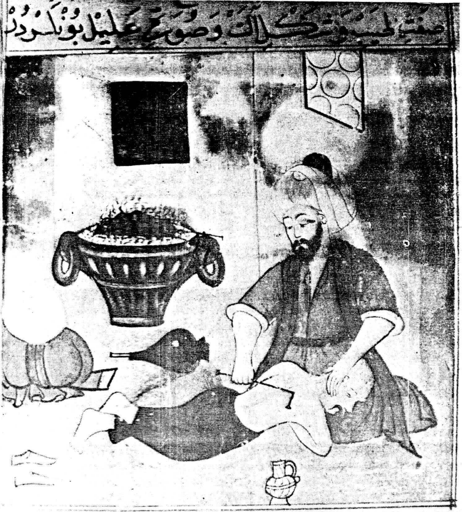
Resim 9. varak 19 a Sırt ağrılarınin dağlamayla tedavisi