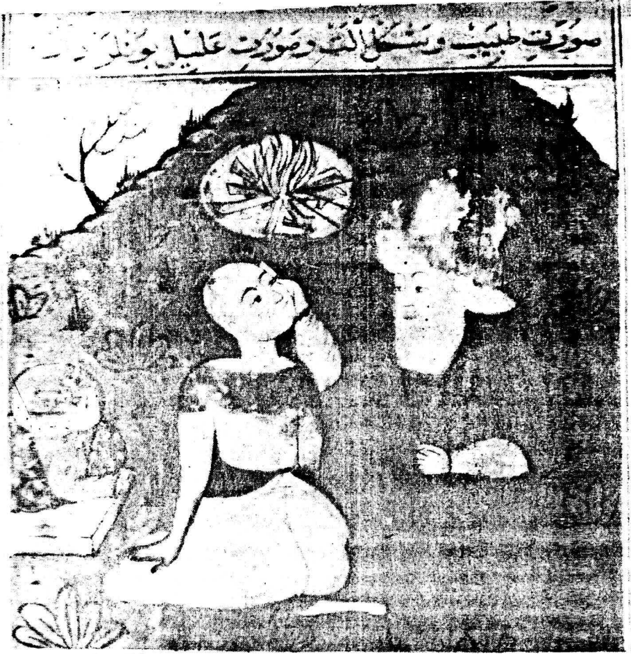
Resim 2. Varak 7 a Gözdeki hastalığın dağılması