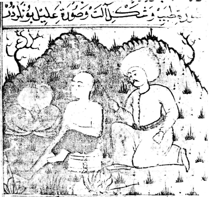
Resim 10. Varak 23 b Basta olan yağ tümörlerinin dağılması