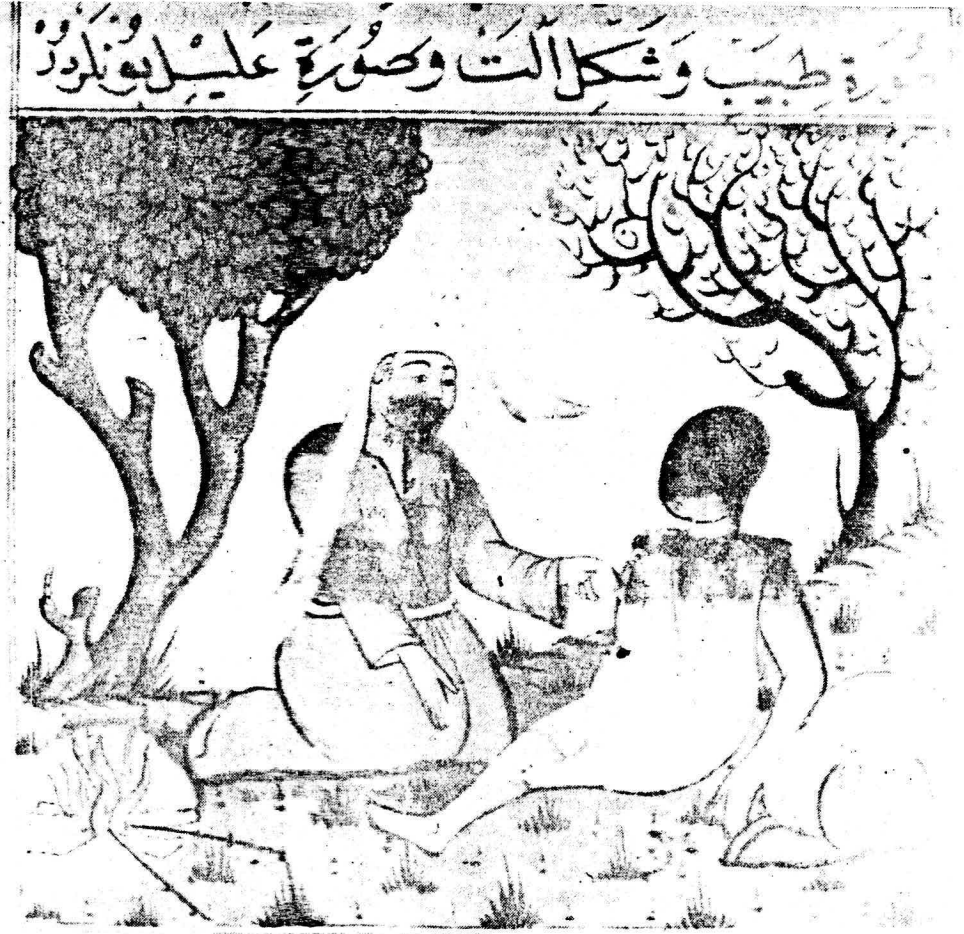
Resim 11. Varak 25 b Vücuttaki yağ tümörlerinin dağılması