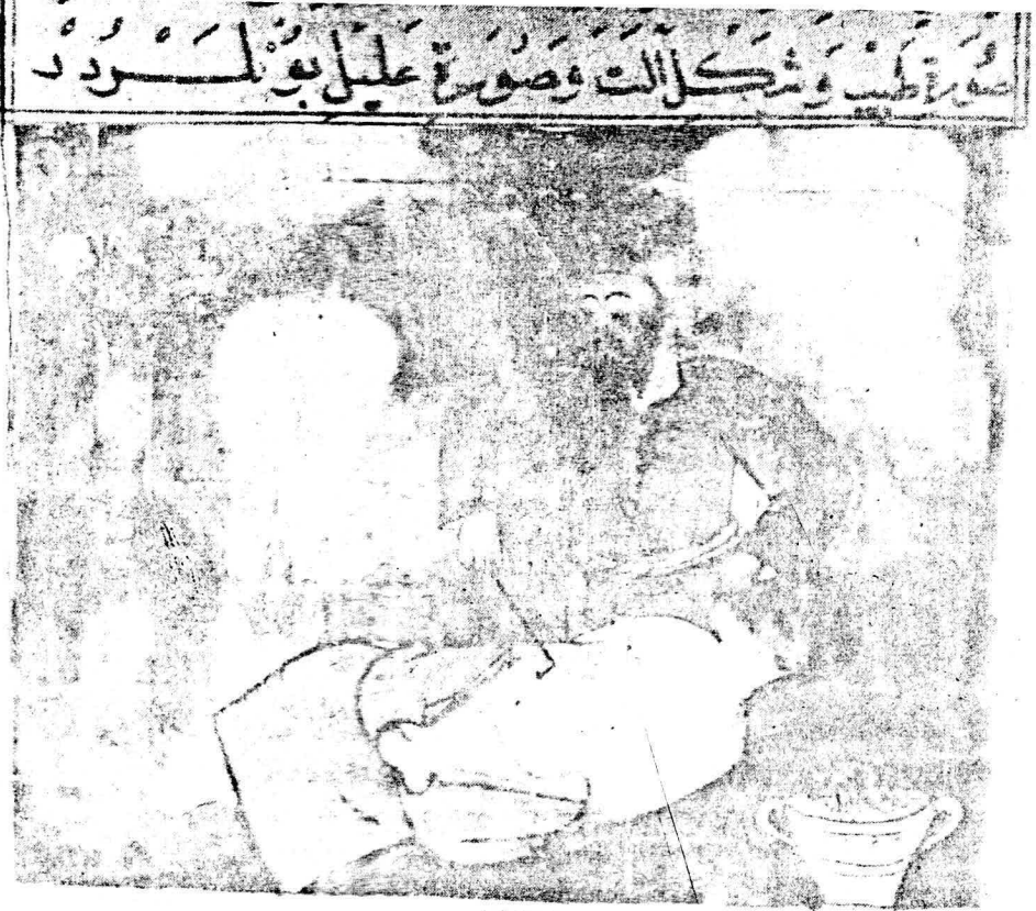
Resim 7. Varak 13 a Kadının gobekten tedavisi.