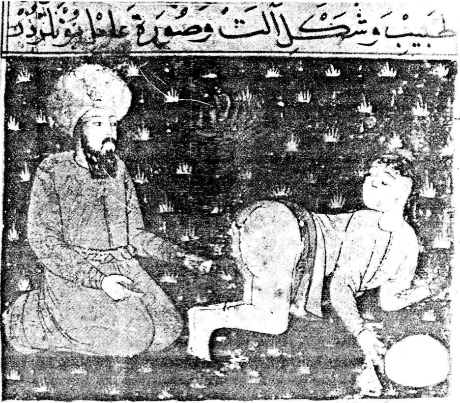
Resim 5. Varak 12 Ab Kadın hastalıklarının dağlamayla tedavisi.