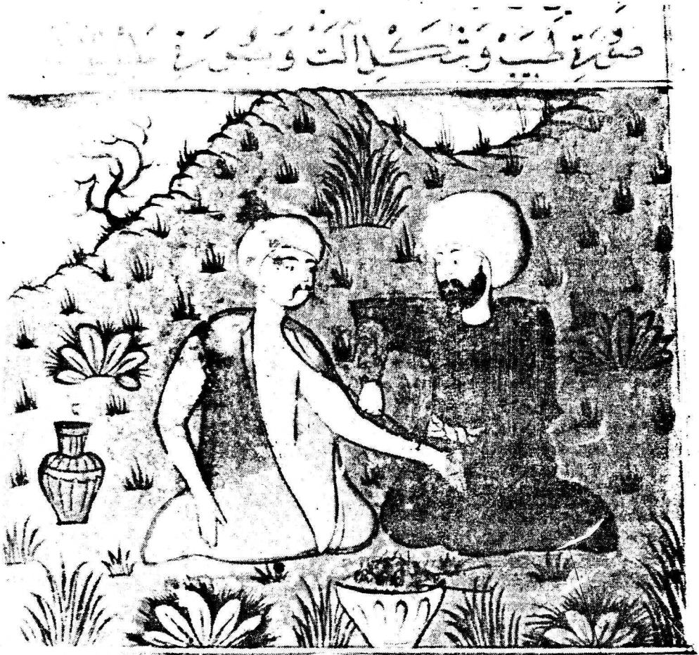
Resim 15. Varak 30 a Üyelerdeki cerahatlerin tedavisi