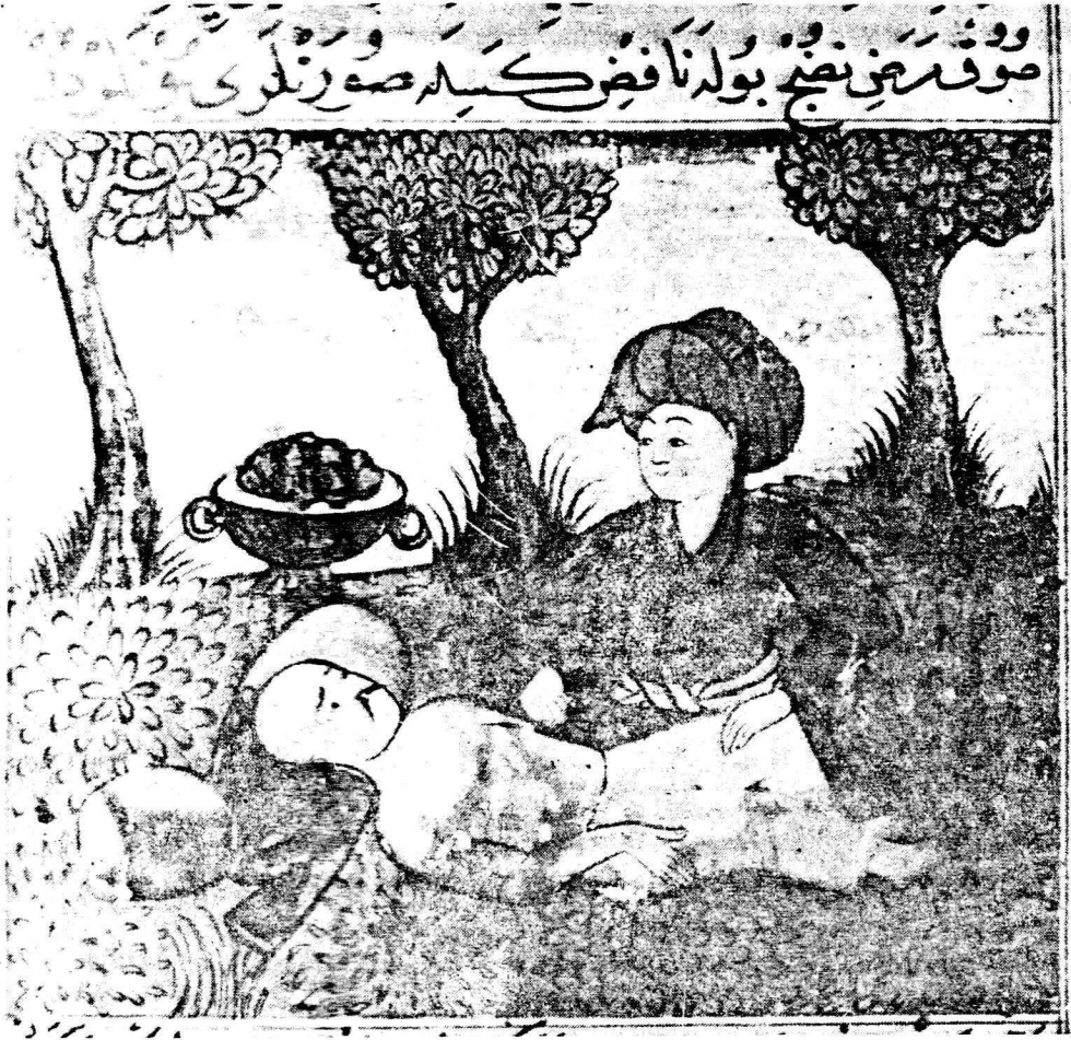
Resim 13. Varak 28 a Bedendeki ağrıların tedavisi