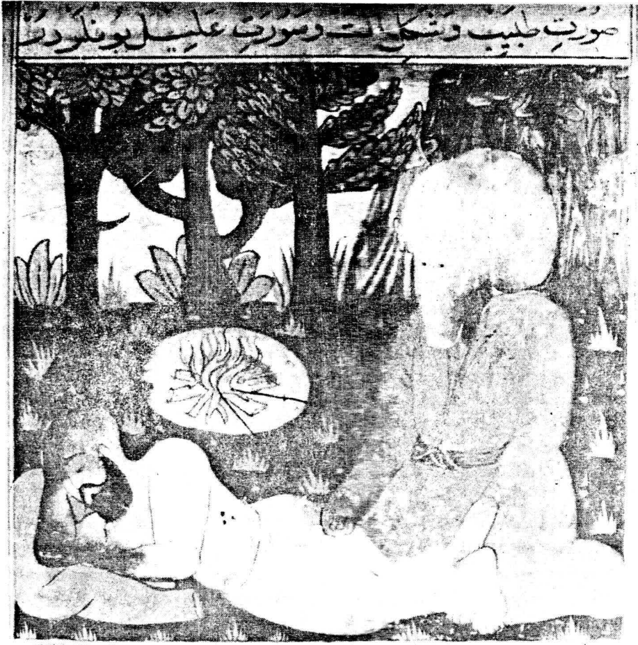
Resim 1. Varak 4b, Yararın dađlanıp desilmesi.