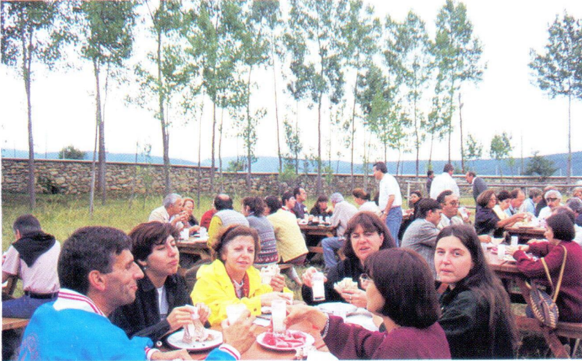
Çekül'cüler (Kastamonu), 1995