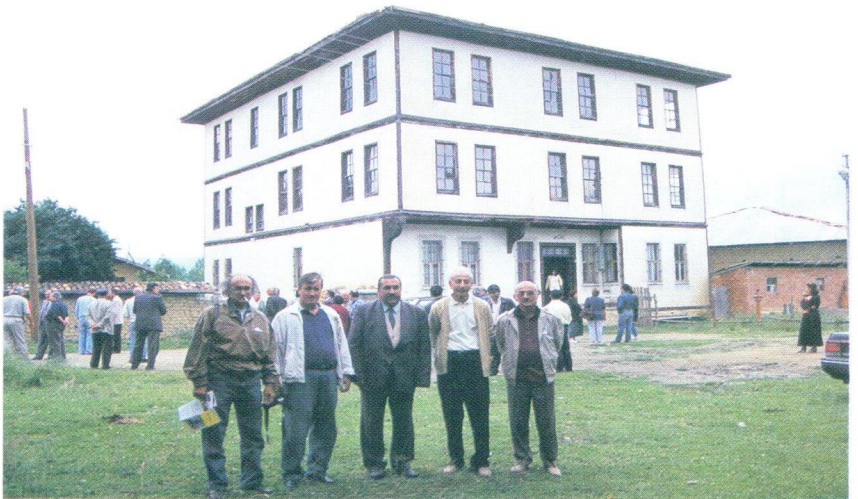
Daday (Kastamonu), 1995