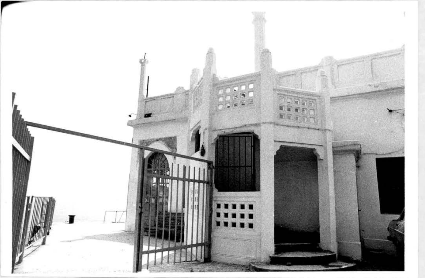
Resim no: 5. Sol yan cephe