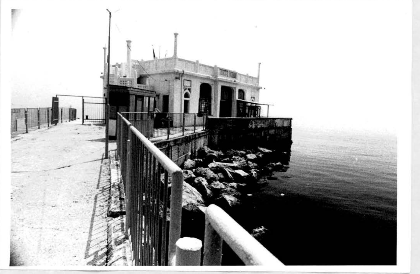
Resim no: 1. Genel görünüm