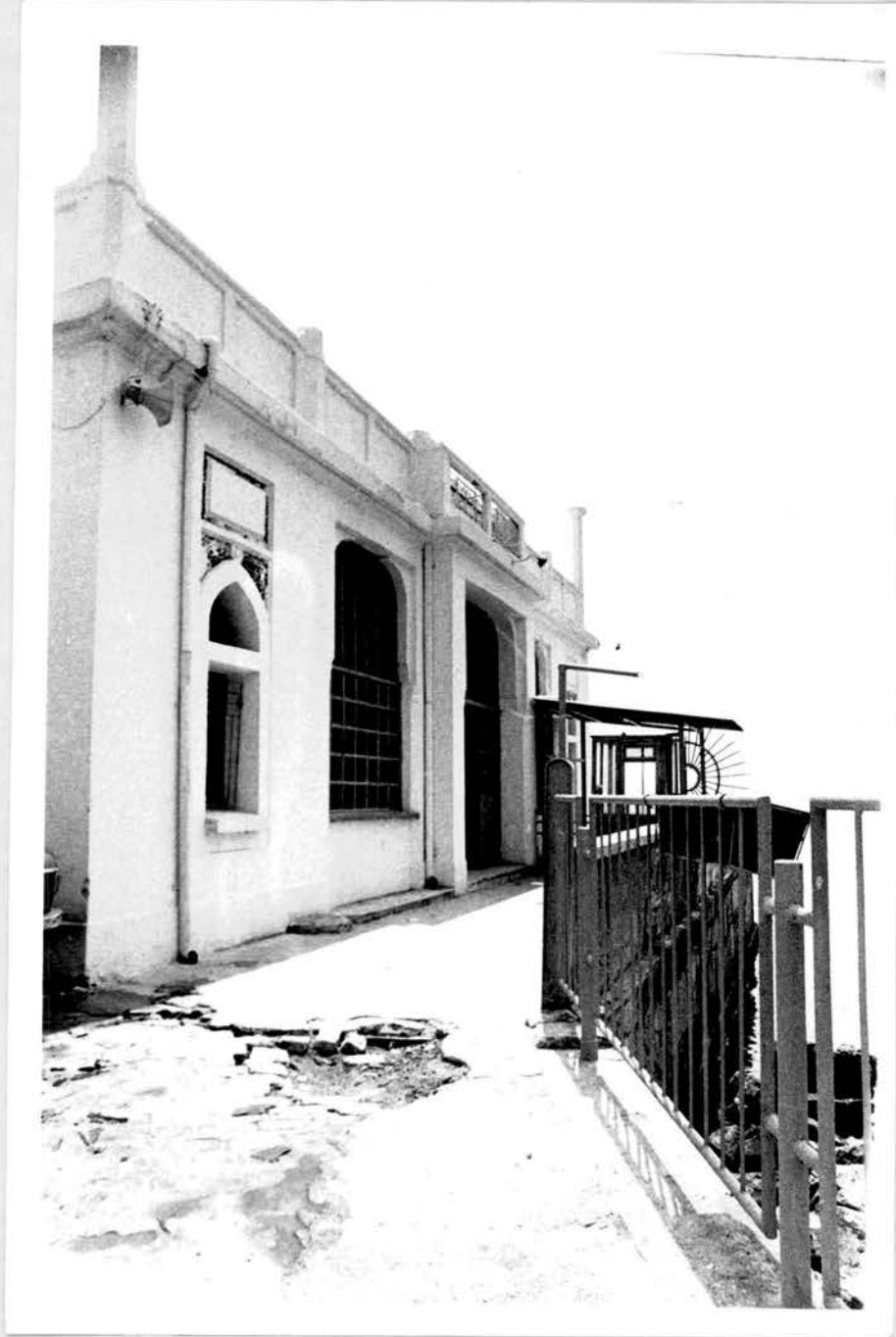
Hesim no: 4. Arka cephe (Giriş cephesi)