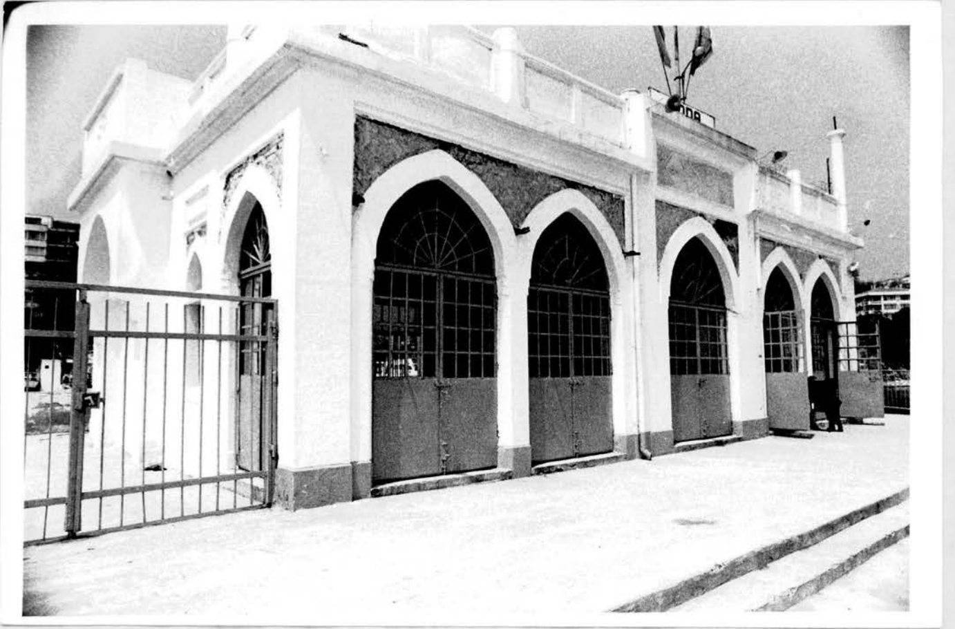
Resim no: 3. Deniz cephesi