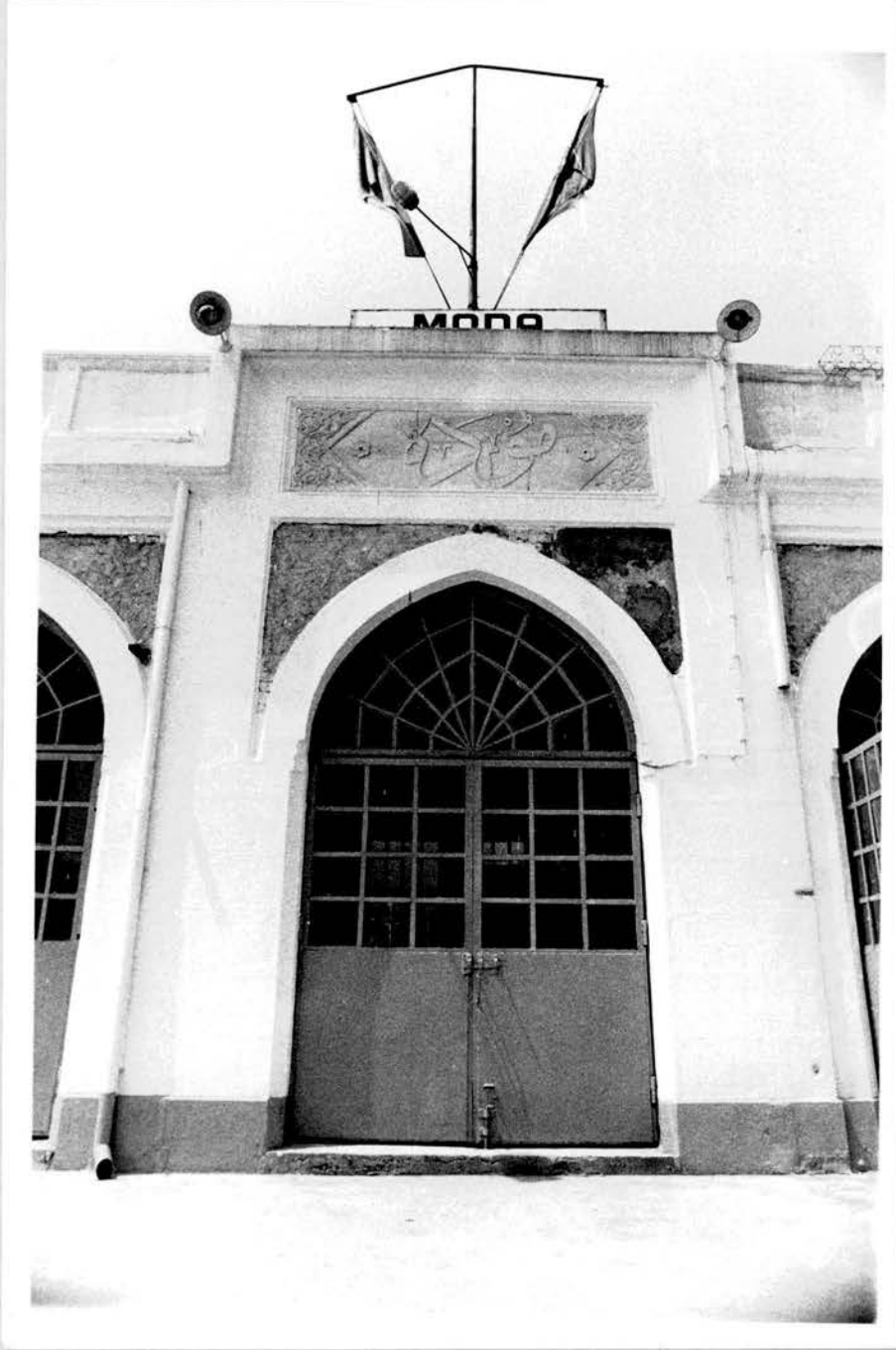
Resim no: 2. Deniz yönü