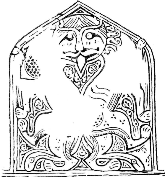
Res. 3 = Abb. 3 — Ars Islamica, V. P II. fig. 14