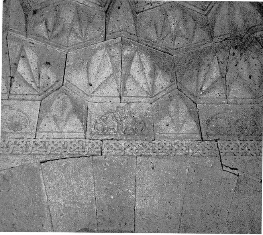
Res. 1 = Abb. 1 — Alay Han portalindeki kabartma