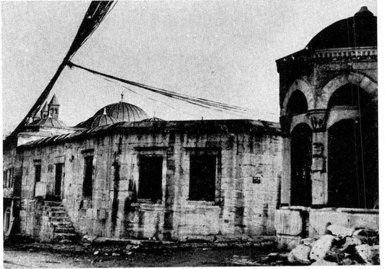
Res. 4 — Yıkılmış olan sıbyan mektebine çıkan merdivenler ve dış avlu duvarı