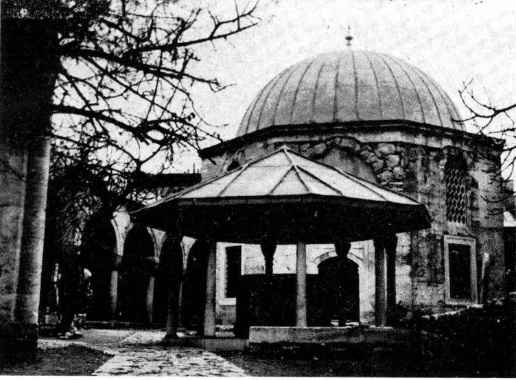
Res. 5 — Tekke avlusu