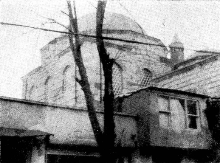
Res. 2 — Haseki Caddesinden Medrese dershanesine bakış