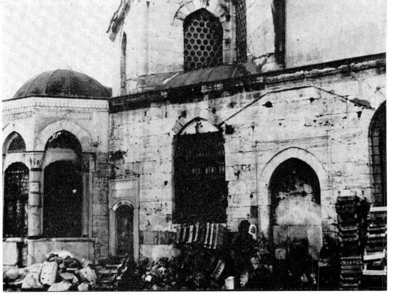
Res. 7 — Sebil girişi, hacet penceresi ve çeşme