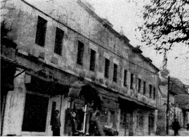
Res. 1 — Medrese yan cephesi ve dükkânlar