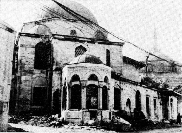
Res. 6 — Türbe ve sebil - arka planda Haseki Camii