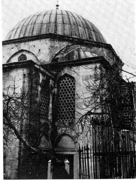
Res. 8 — Türbeden bir ayrıntı - eyvanlarla ana kütle'nin birleşmesi