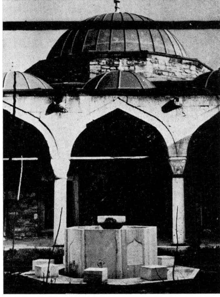
Res. 3 — Medrese avlusu