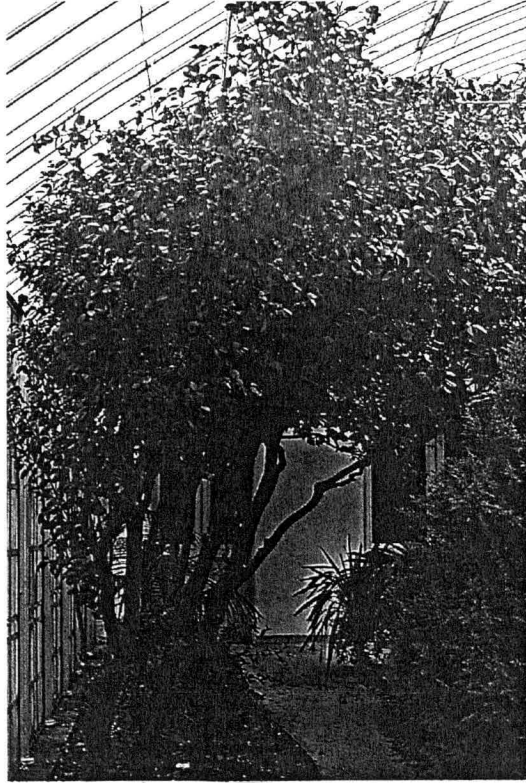
19.yüzyılın romantik çiçeği kamelya Türkiye'ye Osmanlı döneminde geldi. İklim şartlarına çabuk uyum gösteren bu bitki özenli bir bakım istiyor.

Bu bitkinin yüzlerce türü bulunmasına rağmen, istendiğinde özellikle tercih edilen tipine ulaşmakta güçlükler çekilebilir. Çünkü, kamelyalar öylesine zengin bir renk yelpazesine sahiptir ki, isimlendirmede bile zorlukla karşılaşılır. Dört mevsim yeşil kalan bu bitkiler, farklı iklim ve çevre koşullarına kolayca uyum sağlar. Çalı, ağaç, standart bitki ve çit bitkisi olarak yetiştirilir. Kamelyalar oldukça güçlüdürler; kış sonunda ve ilkbaharda renk renk çiçek açarlar. Ancak, dezavantajları, oldukça yavaş büyümeleridir. Kamelyalar bize Amerika'dan, dönemin Washington Sefiri Mavroyani vasıtasıyla gelmiş ve ilk olarak Maslak Kasırları'ndaki seralarda yetiştirilmiştir.