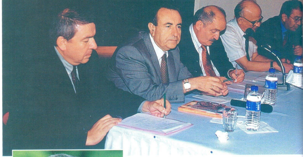
Toplantının ikinci oturumunda eski bürokratlar

Bunun için sürekliliğin sağlanması gerekiyor. Sürekliliği sağlayan bir komite kurulmalı. Proje üretmekten ziyade üretilen projeleri ince şekilde detaylandırıp neler yapılabileceğini takip edilmeli. 1 trilyon bütçenin projelere ayrılmış 800 milyarı yetmez. Çankı-