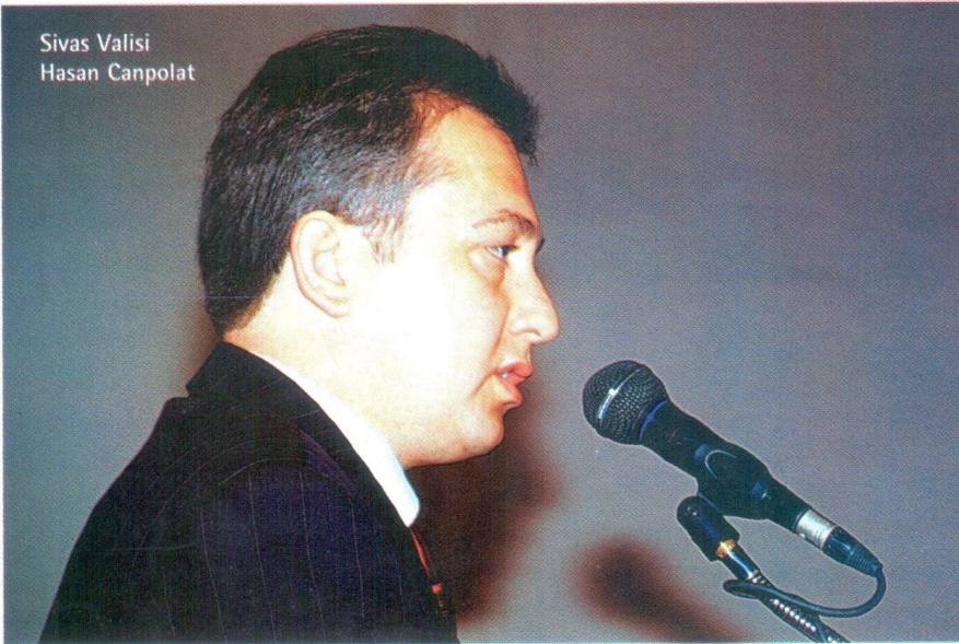
Sivas Valisi Hasan Canpolat

Projelendirmeden finansman ihtiyacının ne olduğunu bilmeye imkan yok. Profesyonelce davranılmasının yararlı olacağını düşünüyorum. FD