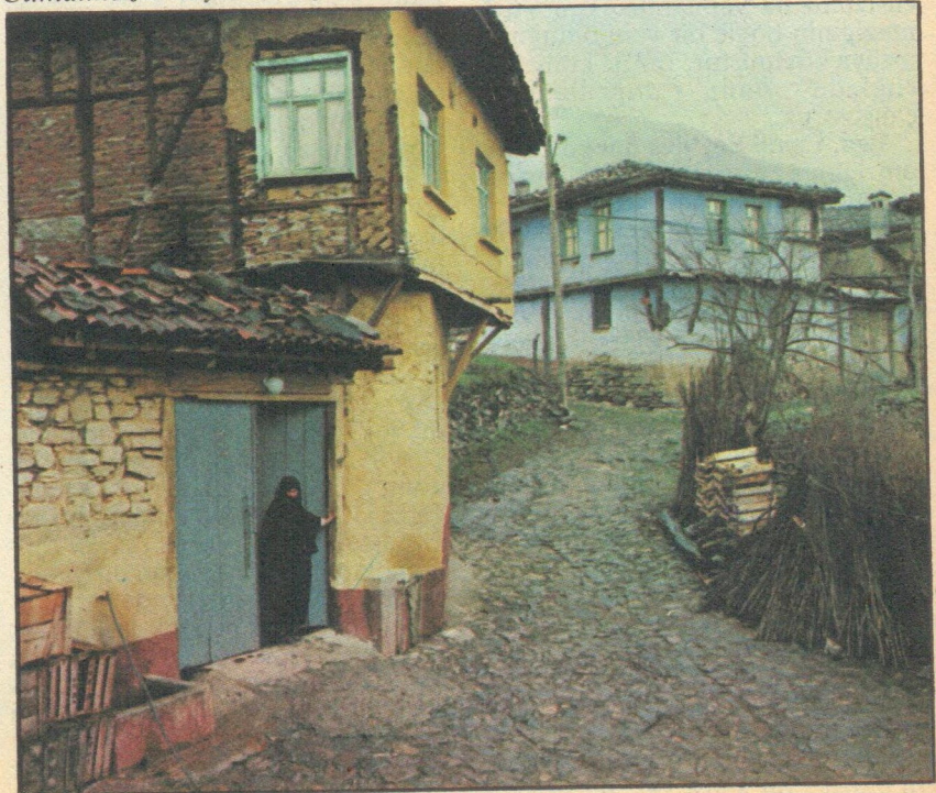
Cumalıkazık köyünün tipik bir sokağı

Bursa'dan gelen bu çağrıda, bir anlamda yarım yüzyılı geçen bir süredir bir türlü sağlıklı çizgiye ulaştıramadığımız tarihsel ve kültürel değerlerimizin korunması, yaşatılması, yenilenmesi, yaşama geçirilmesi çabalarındaki yetersizlikler yatmaktadır. Bursa bunlar içinde somut bir örnektir. Üstelik sanayi-