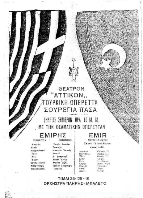
Süreyya Opereti'nin Yunanistan Turnesi'nin afişi...