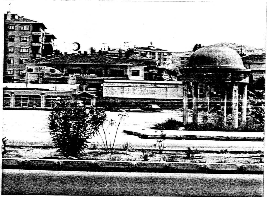
Süreyya Plajı'nın sembolü olan "Bakireler Mabedi" şimdi denize çok uzak...