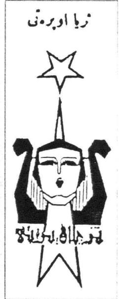
Süreyya Opereti'nin amblemi.