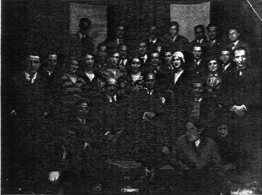
Süreyya Opereti Samsun'da (Karadeniz Turnesi 1931)

Örneğin, 1930 yılında İstanbul Ticaret ve Sanayi Odası'nca kurulan Liman ve Ulaşım Komisyonu'nun yayınlanmış raporu şaşırtıcı oranda çocuksu ve en dar anlamda da gündelik çıkar kaygılarının ürünüdür (9) . Komisyon üyeleri en temel öz çıkarlarından bile habersiz gözükmediler. Raporda İstanbul için yaşamsal önemi olan Haliç köprülerinden birinin kaldırılmasını öneriyorlar. Söz konusu köprünün kentin iki parçalı ticaret merkezinin yaşamasını sağlayan tek öge olduğundan bile habersiz olan bu grup, doğal olarak kentte bir çağdaşlaşma önderi işlevini görememiştir. Yine aynı rapor köprünün kaldırıldıktan sonra da iki taraftaki arsa fiyatlarının düşmeyeceğini öngörerek, yazarlarının kentsel konulardaki cehaleti konusunda yeterli fikir vermektedir. Demek ki, erken Cumhuriyet İstanbul'unda eskisinden de büyük bir kentsel önderlik boşluğu vardır, bu boşluk İstanbul'un bir anlamda parçası, bir anlamda da ikiz kenti olan