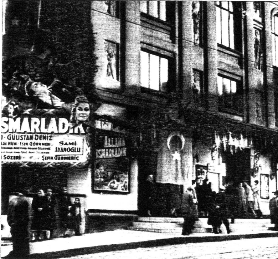
Kadıköy Süreyya Sineması.

Bu koşullarda taşra kentinde değişimin hem talibi, hem de gerçekleştiricisi merkezi yönetimin temsilcisi olan vali olmak zorundadır. Valiler vilayet merkezi olan kenti çağdaştırma kaygısıyla, ellerindeki oldukça