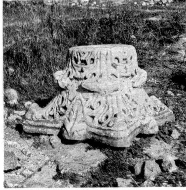
Rhegion'da bulunan bir sütun başlığı.

Küçükçekmece'nin yakın çevresinde, bilhassa gölün etrafındaki kıyılarda bir çok eski ka-