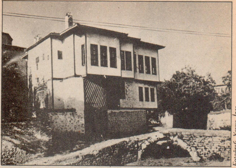
Safranbolu'da kurtarılan bir yapı