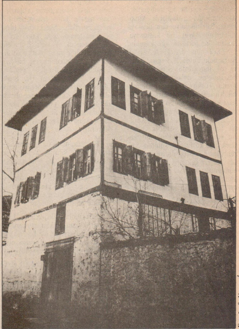
Safranbolu'lular evlerini açarak mimari mirasın korunmasını sağladılar

1975 Mimari Miras Yılı nedeniyle İstanbul'da düzenlenen Tarihsel çevrenin örgütlenmesi konulu seminer bu konuda uzman kişilerin bir araya geldiği ilk ve önemli bir