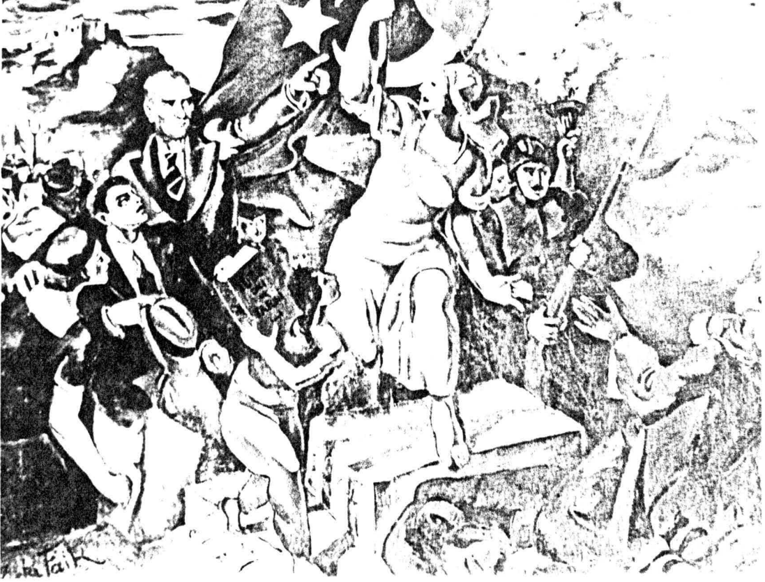
Zeki Faik İzer, "İnkılâp Yolunda", 1933