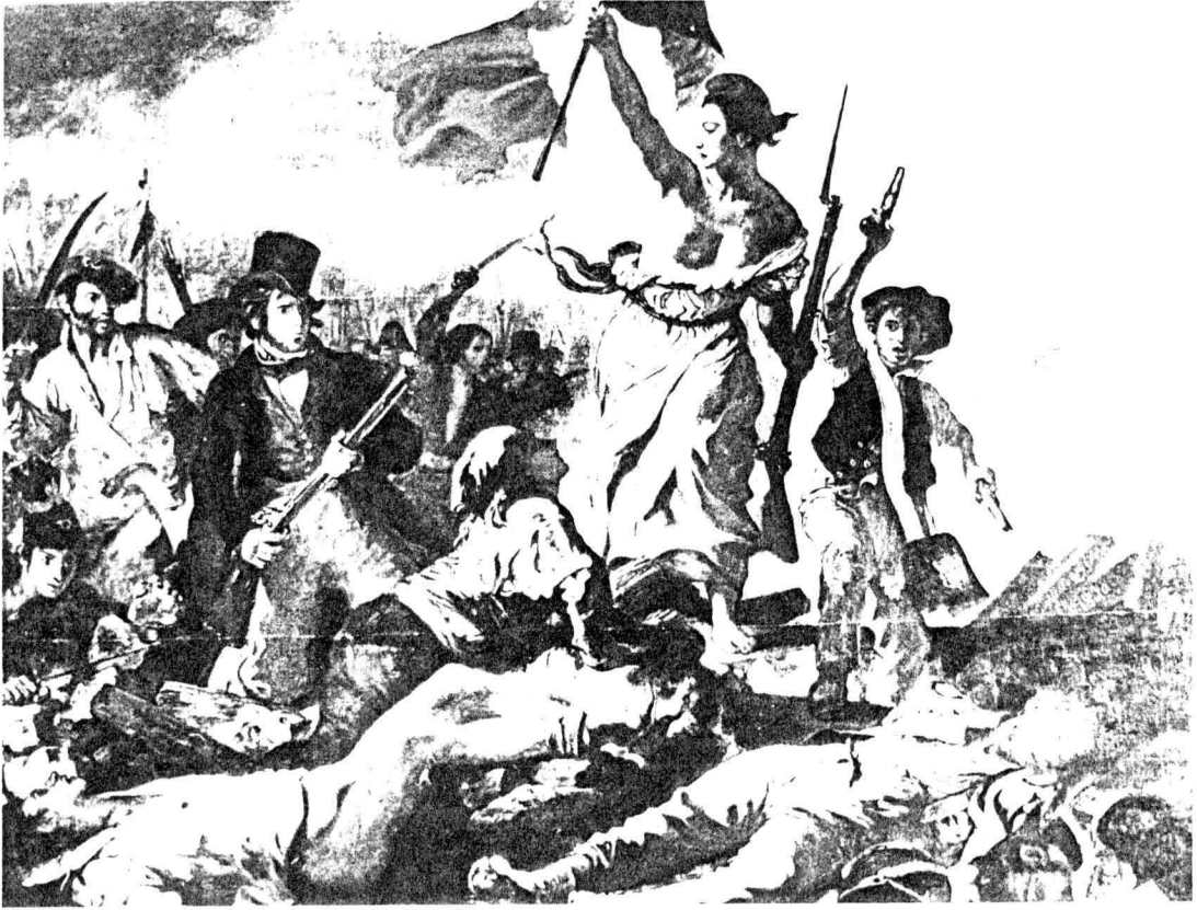
Eugène Delacroix, "28 Temmuz 1830 - Halka Önderlik Eden Hürriyet", 1831